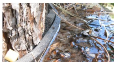
Mariposas de procesionaria del pino capturadas por Procestop